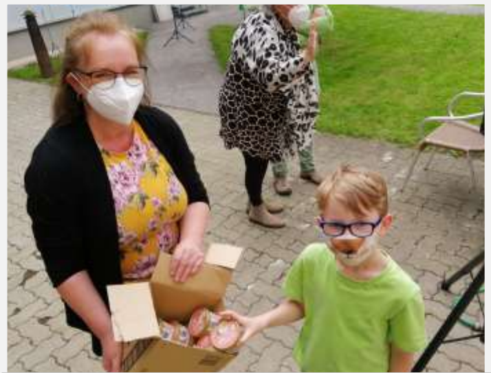
Ein Dankeschön für die Fidinolos